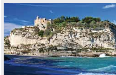
Chiesetta S. Maria dell' Isola - Tropea