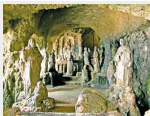
Chiesa di Piedigrotta - Pizzo Calabro