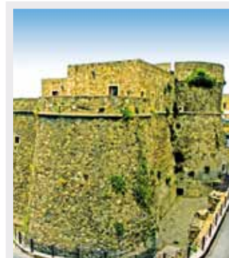
Castello Murat - Pizzo Calabro