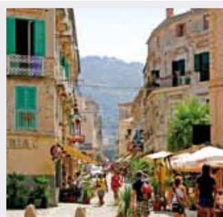
Centro Storico - Tropea