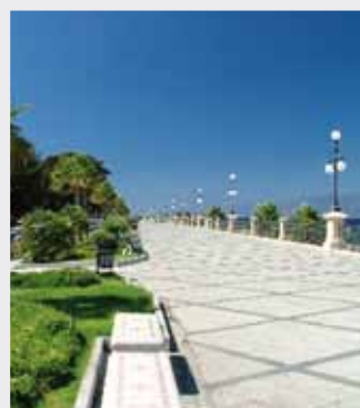
Lungomare - Reggio Calabria