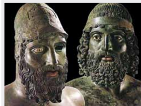
Bronzi di Riace - Reggio Calabria